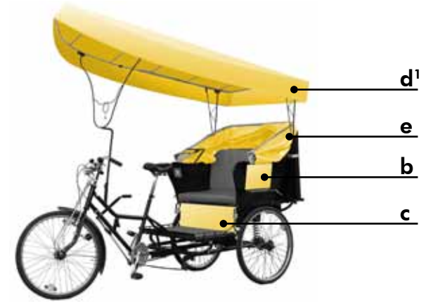
mietbare Werbeflächen einer Rikscha