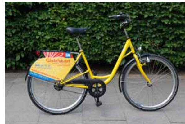
so kann die Fahrrad-Werbung aussehen!