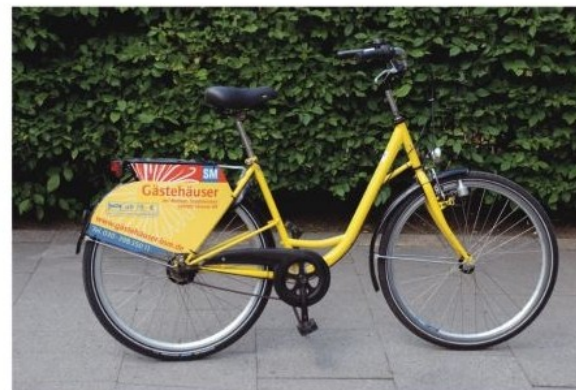
so kann die Fahrrad-Werbung aussehen!

*Alle Preise verstehen sich zzgl. der gesetzlichen Mehrwertsteuer.