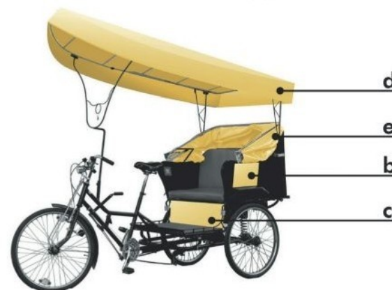
mietbare Werbeflächen einer Rikscha