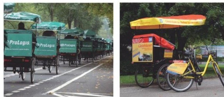
so sehen die Rikschas mit dem vollständigen abcde-Werbeprogramm aus... (Fahrradwerbung siehe S.3)